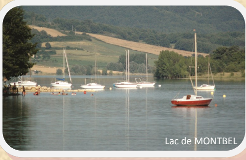
Lac de MONTBEL